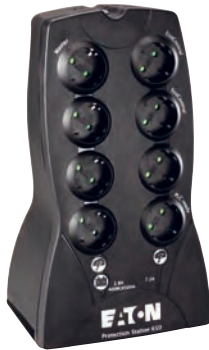
Eaton Protection Station 800