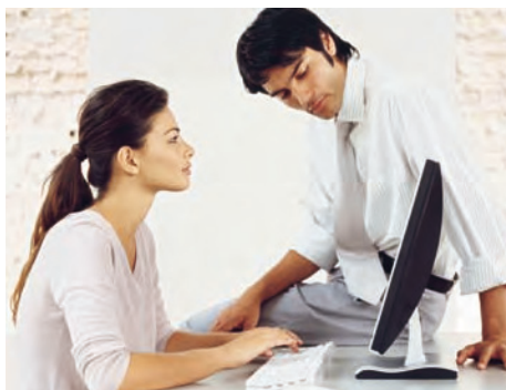
Einfach einstecken – und Ihre Geräte sind geschützt.